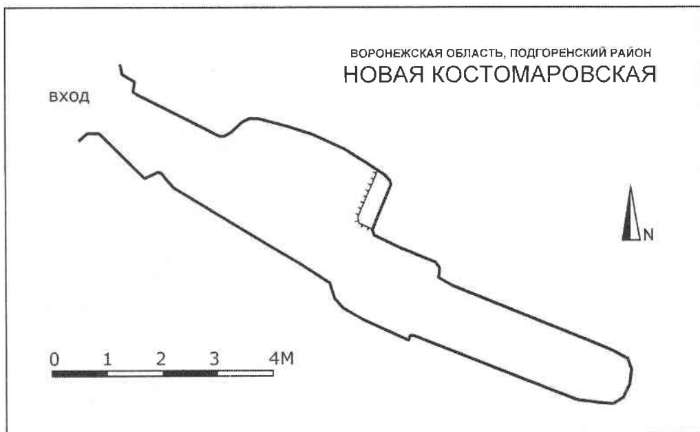
Рис. 4. План Новой Костомаровской пещеры. Топосъемка А. Гунько, В. Степкина, 2011 г.

Неподалеку от Ладожского озера для иконы поставили часовню.