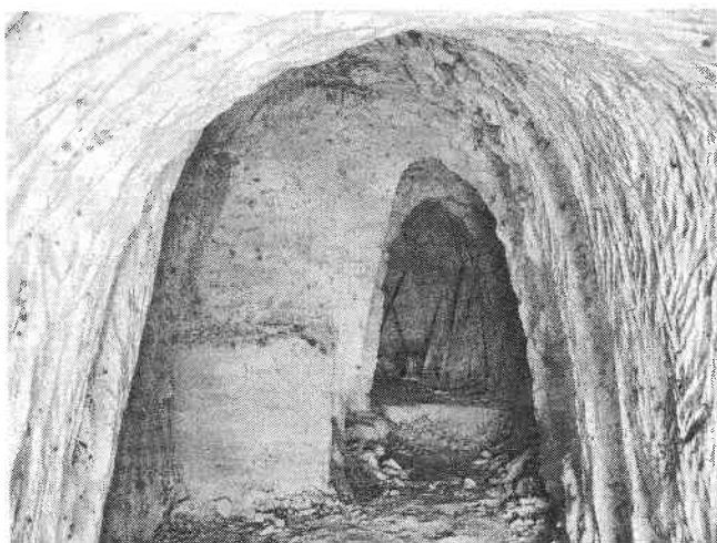
Рис. 5. Общий вид пещеры

Говоря о параллелях прошлого, не будем забывать об ином социальном фоне XXI столетия. В XIX веке первоустроителям подземелий активно помогало местное население, видя в этом подвиг, угодный Богу, при помощи которого можно было искупить множество грехов (Степкин, 2005, с. 135). В XXI столетии местных жителей, желающих бескорыстно помочь И.В. Ляховскому, не нашлось.